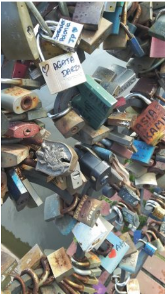
Tuhansia ellei jopa satoja lukkoja. Sillankaide kowaskajalla.