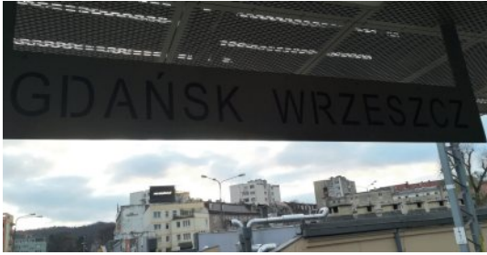
Paljon konsonantteja vähän vokaaleja. Hankala kieli.