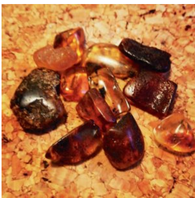
Sopotista ostettua meripihkaa tuleviin projekteihin. Epälyttävän näköinen (slaavi- roisto=nahkatakki ja sänki tukka) möi meripihkaa, ostin ja kotona vasta tajusin kokeilla aitouden. Onneksi oli oikiaa meripihkaa.