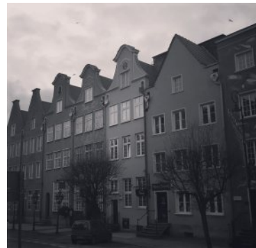
Maanantai Szeroka kadulla