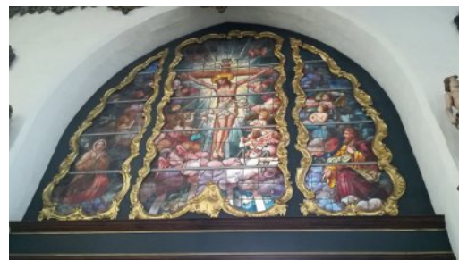
Jokatoisessa korttelissa oli kirkko. Toinen toistaan hienompia. Tässä yksi lasiteos kirkon sisältä (Pyhän Marian kirkko)