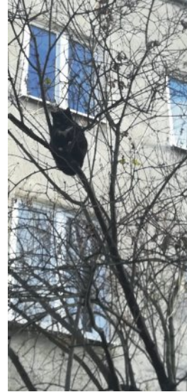
Kulunvalvontaa Vanhassa kaupungissa.